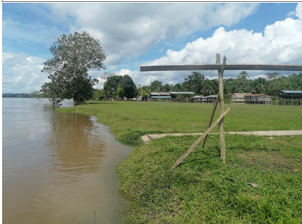
FIGURA N°03: TRAMO DE INTERVENCIÓN, SE APRECIA LA CRECIDA DL RÍO EN CRECIENTE ORINARIA HASTA EL BORDE DEL TALUD, PONENDO EN RIESGO DE INUNDACIÓN A LA COMUNIDAD CAMPESINA LIBERTAD.