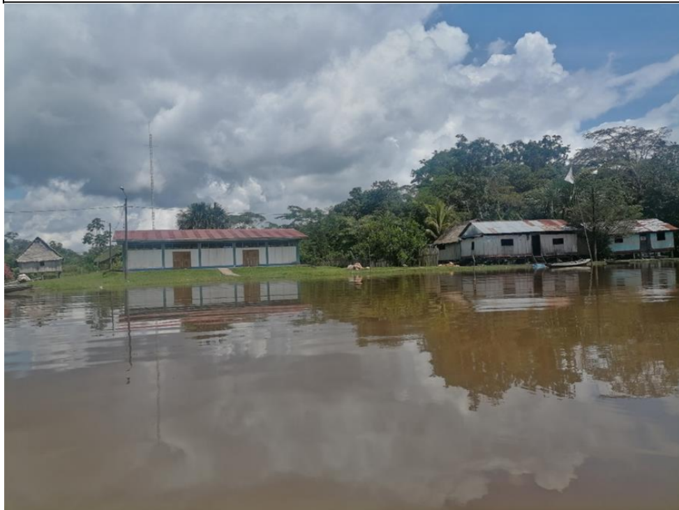
FIGURA N°01: COMUNIDAD CAMPESINA LIBERTAD, VULNERABLE A INUNDACIÓN DEL RÍO NAPO