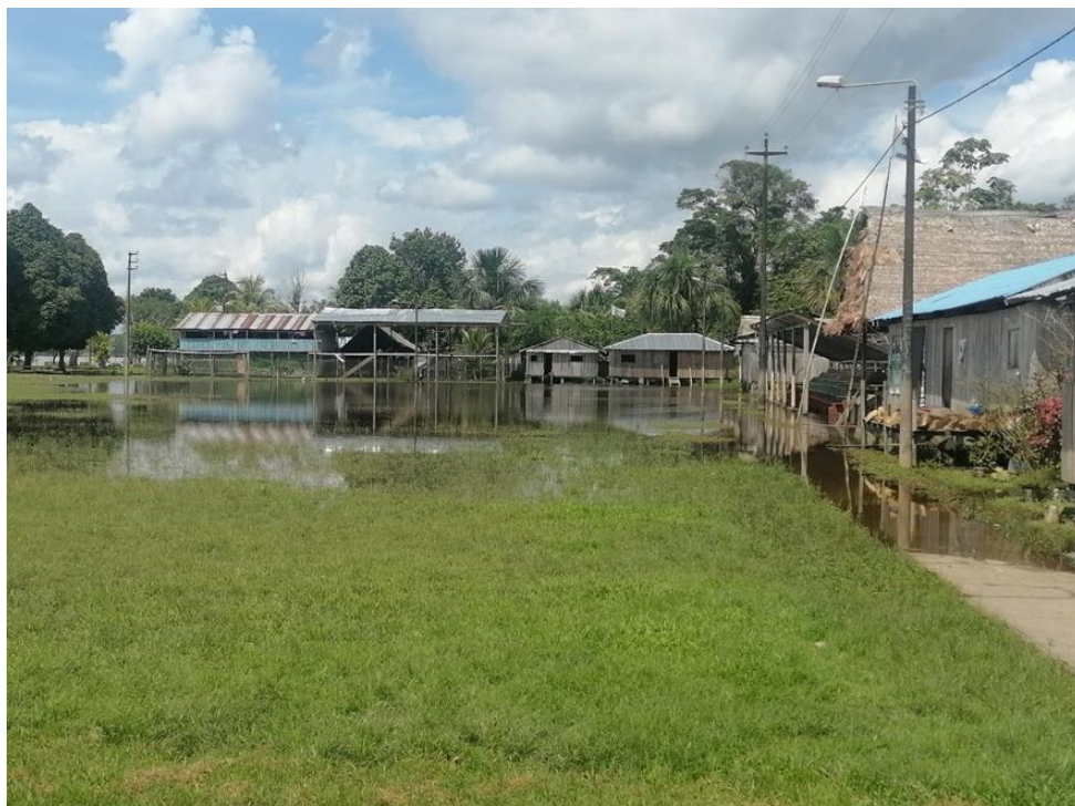
FIGURA N°02: VIVIENDAS E INFRAESTRUCTURAS DE SERVICIO AFECTADAS POR LA INUNDACIÓN DEL RÍO NAPO.